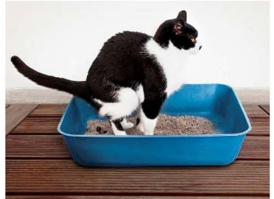
Afb. 2.6 De kattenbak is te klein voor deze kat. Met een kap erop had de kat zijn staart niet kwijt gekund.